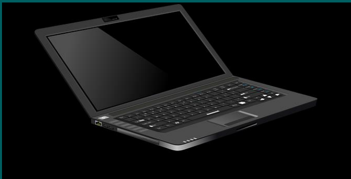
IT materiaal, software, camera's, beeldanalyse, ...